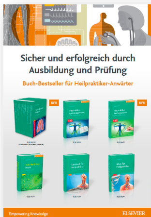
Plakat „Sicher und erfolgreich durch Ausbildung und Prüfung“ A1-Format